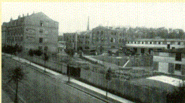
BILD UNTEN RECHTS: Die Zentrale der Konsumgenossenschaft „Vorwärts“ in Barmen, Münzstraße

BILD UNTEN LINKS: Die Zentrale der Konsumgenossenschaft „Befreiung“ in der Elberfelder Hohenzollernstraße