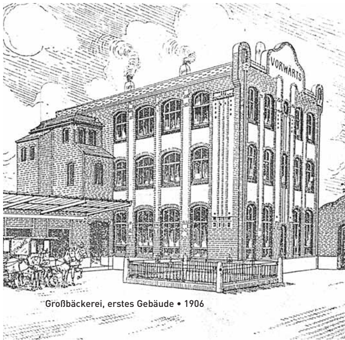
Großbäckerei, erstes Gebäude • 1906